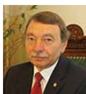
Президент: Георгий Владимирович Майер