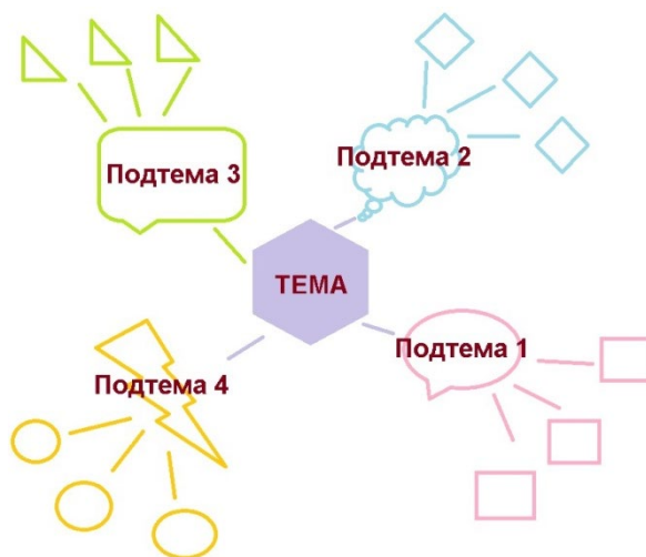
Рис. 1 – Пример диаграммы связей

Вместо длинных предложений используйте ключевые слова и короткие фразы. Это сделает диаграмму компактной и легкой для обзора. Затем создайте дочерние ветви или иерархические уровни. Количество дочерних ветвей не ограничено. Важно чтобы связи вызвали ассоциации и не нарушали логику. Обогадите карту, добавив цвета, иконки и изображения в отдельные темы. Для создания диаграммы связей можно пользоваться любым доступным программным обеспечением, Интернет-ресурсом, либо нарисовать ее от руки. Разместите диаграмму-связей в отдельной теме в курсе на платформе Moodle.