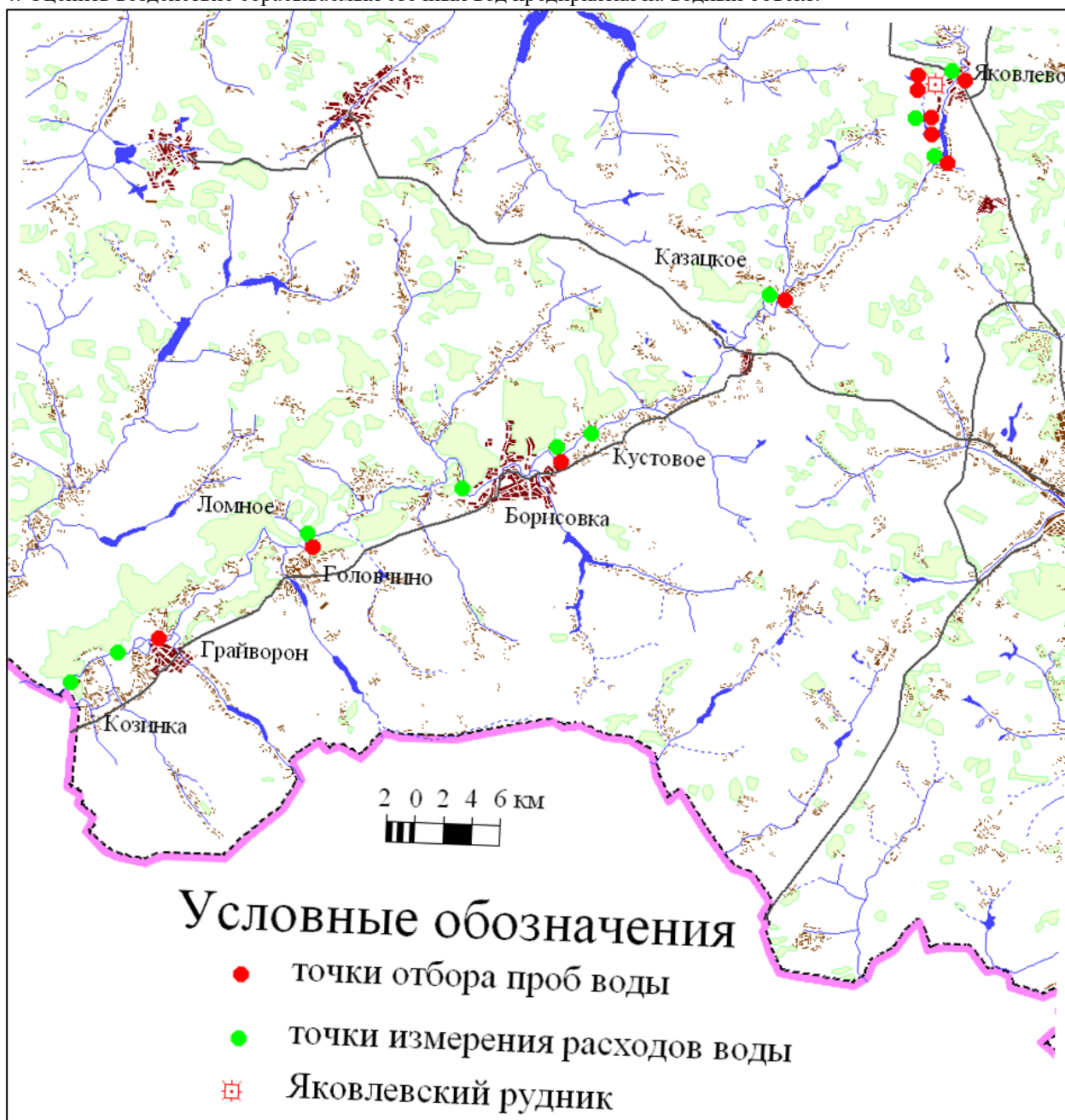
Рисунок 1 – Карта-схема отбора проб воды и измерения расходов воды