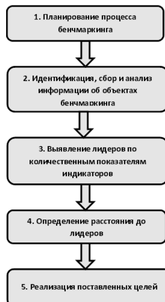
Рисунок 1. Концептуальная модель организации процесса бенчмаркинга устойчивого развития территорий (составлено авторами)

Процесс бенчмаркинга устойчивого развития территорий состоит из нескольких блоков: 1) планирование процесса бенчмаркинга и характеристика объекта 2) идентификация, сбор и анализ информации об объектах бенчмаркинга, 3) выявление лидеров по количественным показателям индикаторов, 4) проектирование будущего уровня измерений объекта сравнения (расстояние до лидера), 5) реализация поставленных целей.