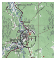
Рис. 1 – Расположение пасеки на местности.

1.1. Рассчитываем общую площадь угодий в радиусе 2 км от точки базирования пасеки (по формуле площади круга, в гектарах).