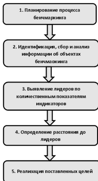
Рисунок А – Концептуальная модель организации процесса бенчмаркинга устойчивого развития территорий

Процесс бенчмаркинга устойчивого развития территории обобщенно представлен на рисунке А.