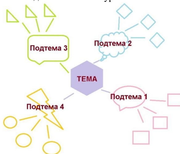
Рис. 1. Пример диаграммы связей

Вместо длинных предложений используйте ключевые слова и короткие фразы. Это сделает диаграмму компактной и легкой для обзора. Затем создайте дочерние ветви или иерархические уровни. Количество дочерних ветвей неограниченно. Важно чтобы связи вызвали ассоциации и не нарушали логику. Обогадите карту, добавив цвета, иконки и изображения в отдельные темы. Для создания диаграммы связей можно пользоваться любым доступным программным обеспечением, Интернет-ресурсом, либо нарисовать ее от руки. Разместите диаграмму-связей в отдельной теме в курсе Moodle.