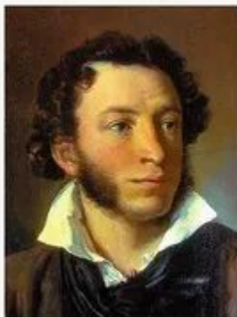
А. С. Пушкин (1799-1837 гг.)

Бранил Гомера, Феокрита; Зато читал Адама Смита И был глубокой эконо- м, То есть умел судить о том, Как государство богатеет, И чем живет, и почему Не нужно золота ему, Когда простой продукт имеет.