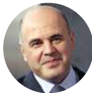
Михаил Мишустин, председатель правительства РФ

“ Вы храните лучшие традиции российского образования и создаете новые направления. Отдаете все силы своему призванию , вкладываете в него душу . Такой труд вызывает уважение , благодарность и искреннее восхищение .