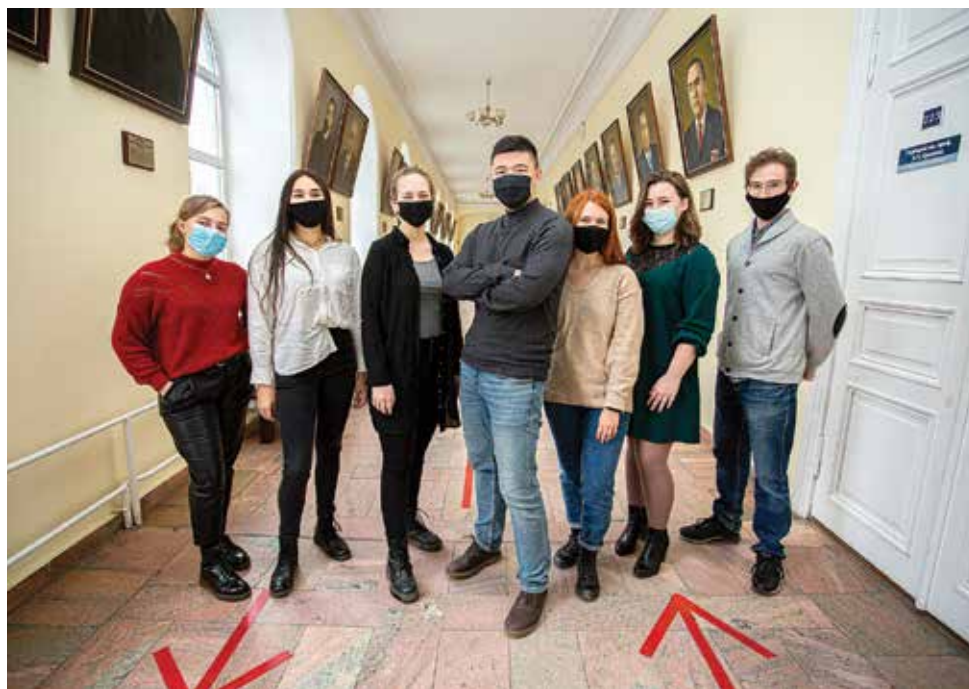
Сотрудники психологической службы ТГУ готовы бесплатно консультировать всех, кто обращается за помощью, независимо от возраста и места жительства.

Поможет любая деятельность, которая приносит радость. Забота о своем состоянии – физические упражнения, хороший сон, сбалансированное питание. В этом плане рекомендации довольно универсальны. Как один из «рецептов» или рекомендация: заниматься каким-то физическим трудом, разумеется, посильным, это как профилактика. Лучше это делать