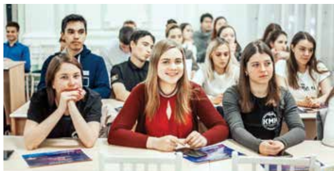
Награждение Университета Лидеров, октябрь 2019. Ровно год назад никто не подозревал, что такие масштабные мероприятия станут опасны для здоровья.

– Сама программа – нет, это все такие же традиционные кураторские часы. Каждый кураторский час имеет