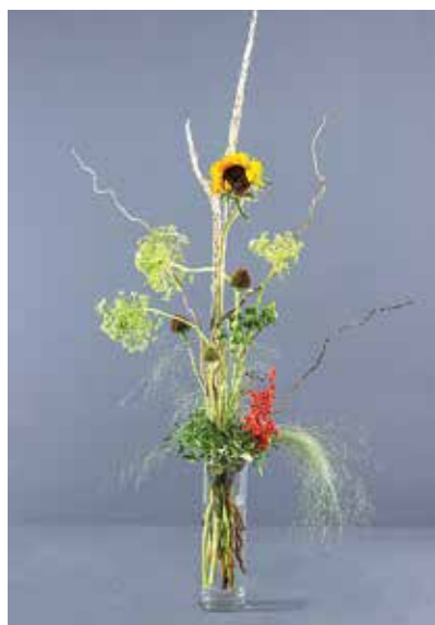
Фото предоставлено Алексеем Черемисиним.

– Я не сразу пришел к флористике. Пытался рисовать, фотографировать, создавать коллажи. Но все было немножко не то. А теперь работаю с цветами, и я счастлив.