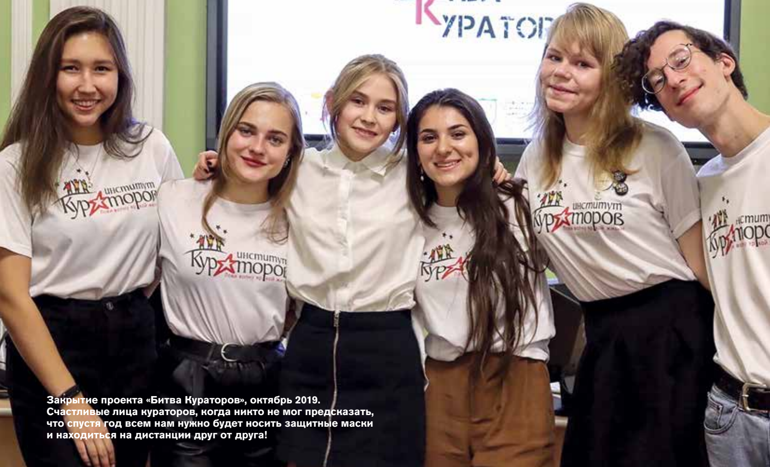
Закрытие проекта «Битва Кураторов», октябрь 2019. Счастливые лица кураторов, когда никто не мог предсказать, что спустя год всем нам нужно будет носить защитные маски и находиться на дистанции друг от друга!

конце августа – начале сентября. Обучение проходило намного легче, чем я думала. Да, были свои казусы и нюансы, но мы совместными усилиями нашего дружного коллектива с ними справились. У нас было пять занятий, которые мы проводили на удобной для нас платформе, где мы передавали знания, которыми обладаем сами.